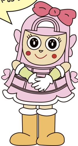
野洲市商工会イメージキャラクター うわさの やよいちゃん